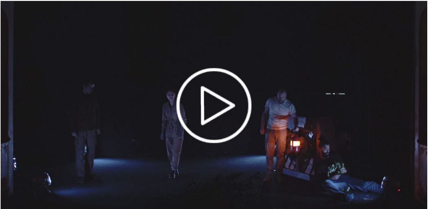
Hombourg - extraits vidéo, étape de travail, janvier 2024

Hombourg considère finalement sa sentence comme légitime. Le voyage semble s'achever lorsqu'il se présente devant ses bourreaux. Mais au dernier instant, il est gracié : « Est-ce un rêve ? »