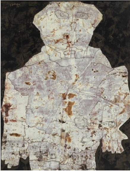
Jean Dubuffet, Le Géographié , 1955