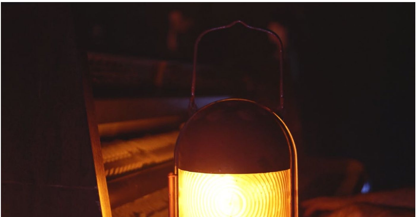
Hombourg, étape de travail, janvier 2024

Contact : arnaud.raboutet@gmail.com / 06 58 83 99 58