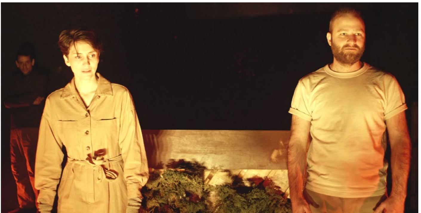
Hombourg, étape de travail, janvier 2024

Réalité et fiction se rejoignent en une scénographie souple, parée pour répondre aux vicissitudes du monde. Cette proposition s'inscrit dans notre désir de développer un théâtre de proximité, en composant des formes à la fois sobres et puissantes.