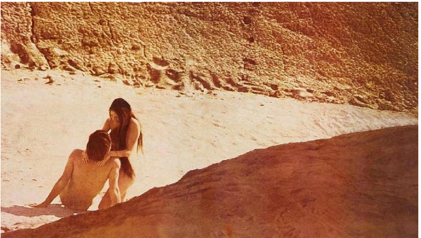
Michelangelo Antonioni, Zabriskie point , 1970

La première édition est envisagée pour le printemps 2025, en Vallée de la Seine. C'est une proposition artistique qui dure environ trois semaines et révèle sous un angle inattendu le territoire qu'elle traverse. La réalisation du film permet également de partager un objet lié à cette expérience et dans lequel chacun peut se reconnaître.